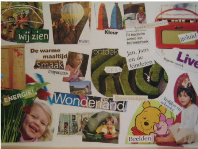
Figuur 2: collage van referentiebeelden

is door referentiebeelden te verzamelen (zie figuur 2). Dit levert per onderdeel diverse ideeën op: het ziekenhuisbed; themabedden, een kind kan het bed kiezen met een favoriet sprookjesfiguur. communicatie, educatie en multimedia apparatuur; beeldtelefoon waarmee ouders gebeld kunnen worden. Een weblog waarop kinderen hun laatste tekeningen kunnen laten zien aan broertjes, zusjes en vriendjes. omgevingsinterieur en medische apparatuur; het vriendelijk vormgeven van medische apparatuur en overbodige apparatuur 'onzichtbaar' maken.