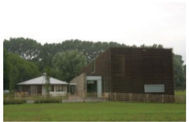
Ronald McDonald Huis, Tilburg

renen en een unit voor kinderen tot 16 jaar. Verder is er een unit dagbehandeling.